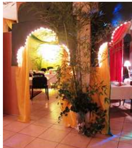
La salle St. Pierre transformée pour un soir en palais indien

Nous avons également été très contents de rencontrer de nouvelles personnes de la paroisse. Toutes nos félicitations, donc, pour l'organisation, et encore merci. »