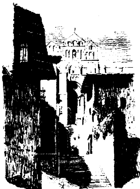
Cathédrale du Puy-en-Velay

Au Puy depuis le Moyen-Age, l'Église fête un jubilé chaque fois que le Vendredi-Saint tombe le 25 mars. Sont alors célébrées le même jour, la conception et la mort du Christ, les deux grands mystères de la foi chrétienne, l'incarnation et la rédemption. En effet, les raisons pour lesquelles Jésus est mort sont les raisons pour lesquelles il est né. Pour les chrétiens, Jésus est le premier né d'une multitude de frères.